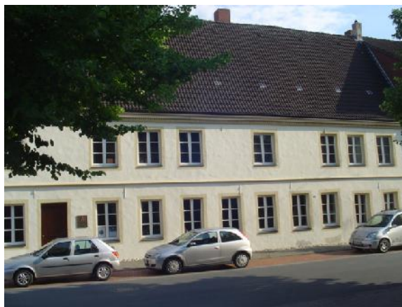
Dormitorium Südstraße 21, 59269 Beckum