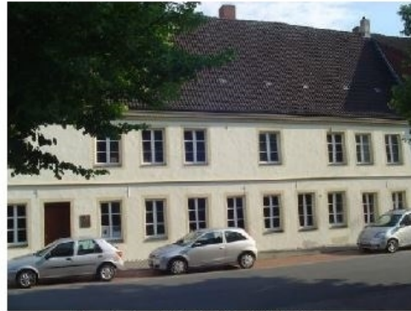
Dormitorium Südstraße 21, 59269 Beckum